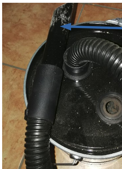
Embout seau à cendre

Pour aspirer, allumer l'aspirateur et utilisez l'embout du seau à cendre :